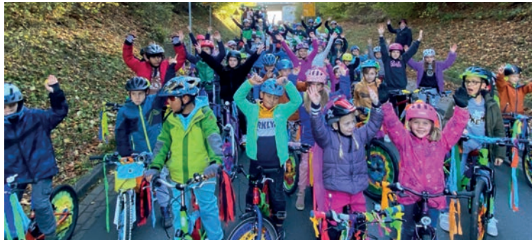
Die „Fahradkinder“ mit den Alte Herren im Hintergrund beim Umzug am Sonntag

Aufgeteilt in verschiedene „Arbeitsgruppen“ haben die Beuerbacher Vereine gemeinsam mit der Kerbegesellschaft die diesjährige Kerb organisiert. Nun können sie stolz auf ein erfolgreiches Fest zurück blicken. An allen Tagen gut besucht, eine tolle Stimmung bei Gästen, Helfern und Organisatoren und sogar das Wetter war perfekt!