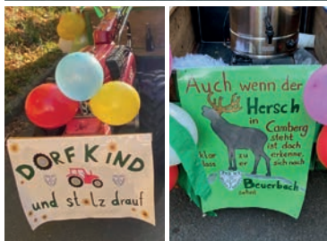
Die Zugnummer vom TuS 03 und der Glühweinwagen

scheins freuten sich die Zuschauer über den Glühwein, der ihnen (neben Eierlikör) von den Hühnern der Body-