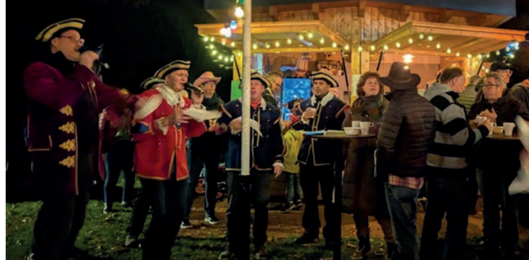
Die BNG bei der Eröffnung der Kampagne am 11.11.2024 am „Hiddje“

www.willkommen-shop.de stehen die Organisatoren per E-Mail, WhatsApp oder telefonisch zur Verfügung und helfen gerne weiter. So wird sichergestellt, dass niemand auf den Spaß verzichten muss.