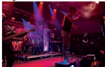
Die Band „Saunaprojekt“ heizt ein

Bis auf das letzte Stück verkauften die Landfrauen in der voll besetzten Mehrzweckhalle ihren leckeren selbst gebackenen Kuchen. Zahlreiche Kinder ließen sich beim Kinderschminken ihre Gesichter kreativ gestalten und zogen bei der Tombola die Lose aus der großen Lostrommel. Die sechs Hauptpreise wurden im Rahmen von drei Runden der Spielschou „Tor des Glücks“ vergeben. Der Sonntagabend endete in gemütlicher Runde beim Beuerbacher Abend in der Gaststätte l'Evento. Auch der Gasthof Gilberg war zum Frühschoppen mit Kerbeausklang am Montag noch gut besucht. (mhc)